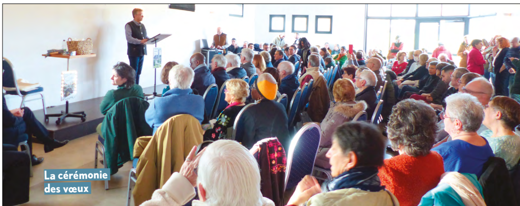
La cérémonie des vœux