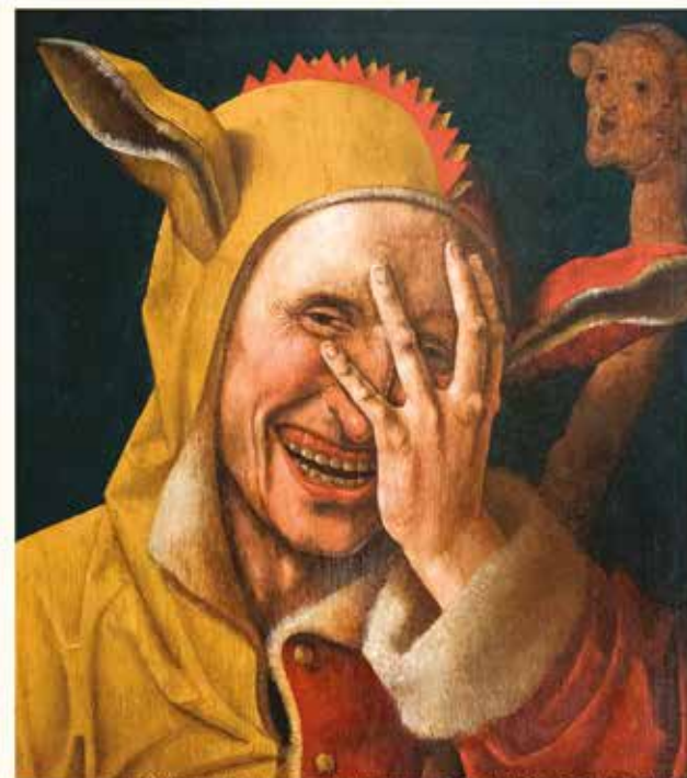
Portrait de fou regardant à travers ses doigts - Maître anonyme de 1537 ou Maître de Ecce Homo d'Augsbourg

WE, jours fériés et 12 nov. 14h-19h 30 octobre - 14 novembre 2021